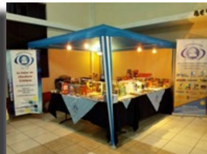
1.-Vista de los mensajeros a la 69 Asamblea Anual Bautista. 2.-Bandera del Estado de Tennessee, EE.UU. en la ceremonia del convenio entre las convenciones bautistas de Guatemala y Tennessee. 3.-Stand de la Librería Bautista, que junto con otros ministerios exhiben sus mejores recursos e información.