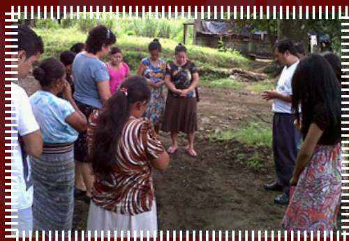
Hermanos orando en el local de la misión de Mirandía.

MOVIMIENTO MISIONERO EN HOREB. La iglesia de este nombre que se ubica en la Col. Hunapú, de la ciudad de Escuintla, ha estado activa en la apertura y consolidación de sus obras misioneras. Primero, ha abierto una nueva misión en Mirandía, con la esperanza que florezca. Segundo, dieron apertura oficial a su Misión Bautista “Lirio de los Valles” de la Col. El Mango, Escuintla, el 8 de noviembre, con una hermosa reunión, en el templo que fue adquirido de otra misión evangélica. La iglesia además cuenta con un numeroso grupo de jóvenes, dispuestos a trabajar en el evangelismo y las misiones y los cuales en octubre fueron agasajados. Es pastor de la Iglesia, el Hno. René Cifuentes Rodas. ¡Adelante Horeb, con la labor en misiones!