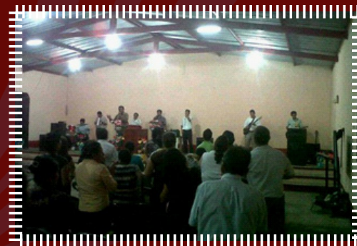
El ministerio de alabanza “Caballeros de Visión” de la Iglesia Bautista Horeb, con su participación en El Mango.