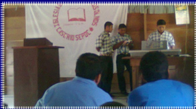
Los jóvenes músicos de la Iglesia Bautista “Monte de los Olivos” de Sepoc, Chahal, dirigen la alabanza en el culto.