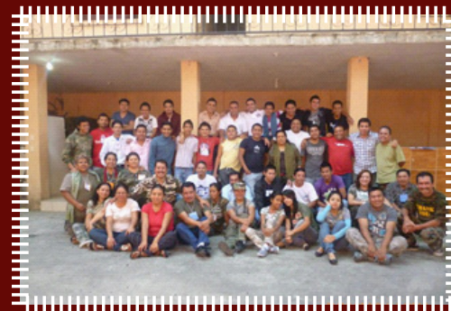
Hermoso grupo de jóvenes y sus consejeros de la Iglesia Horeb, recientemente homenajeados por su fidelidad a Dios.