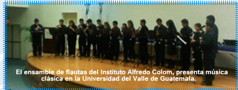
El ensamble de flautas del Instituto Alfredo Colom, presenta música clásica en la Universidad del Valle de Guatemala.