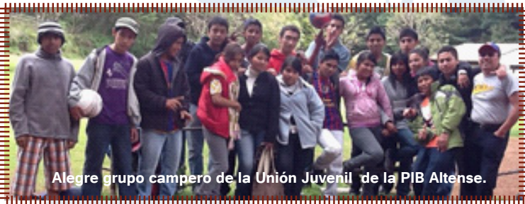
Alegre grupo campero de la Unión Juvenil de la PIB Altense.