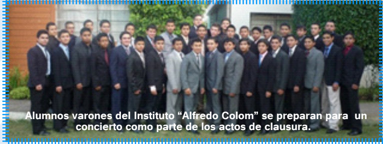
Alumnos varones del Instituto "Alfredo Colom" se preparan para un concierto como parte de los actos de clausura.

Otros actos de clausura de labores incluyeron un recital de flautas, el 3 de Octubre; un concierto de despedida por los profesores, el 10 de octubre y el concierto de los alumnos con el coro, la banda y percusiones en el Teatro "Abril" el 17 del mismo mes. ¡Felicitaciones tan prestigiosa Institución cristiana de Música, única en su género en América Hispana".