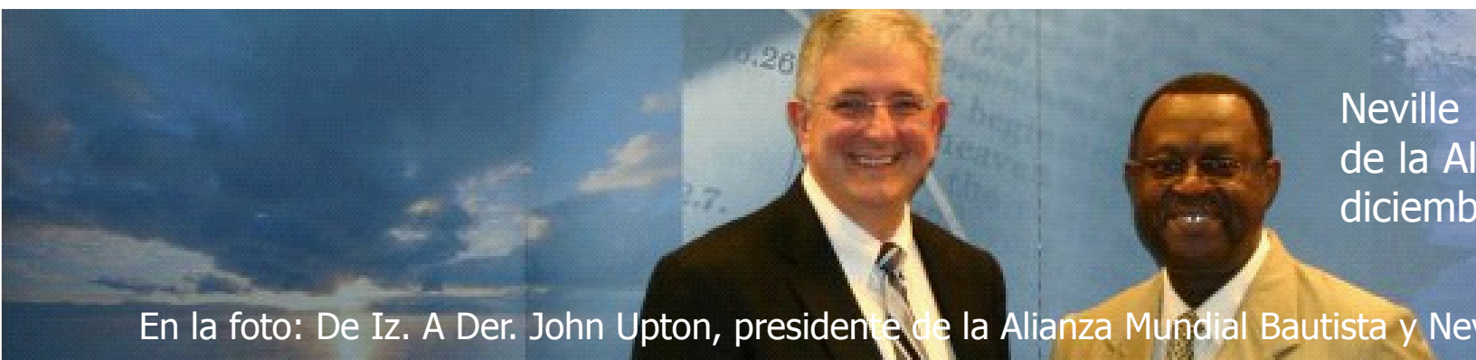
Neville de la A diciemb

¿Podría ser que Dios se apareció hace poco en la forma de un ex-