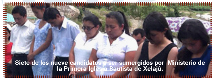
Siete de los nueve candidatos a ser sumergidos por Ministerio de la Primera Iglesia Bautista de Xelajú.