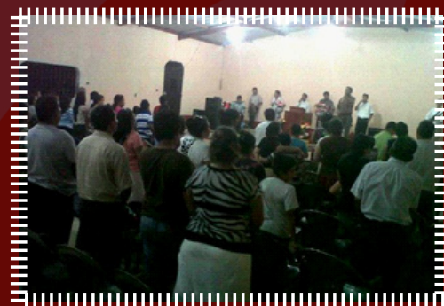
Culto de apertura oficial de la Misión Bautista en El Mango