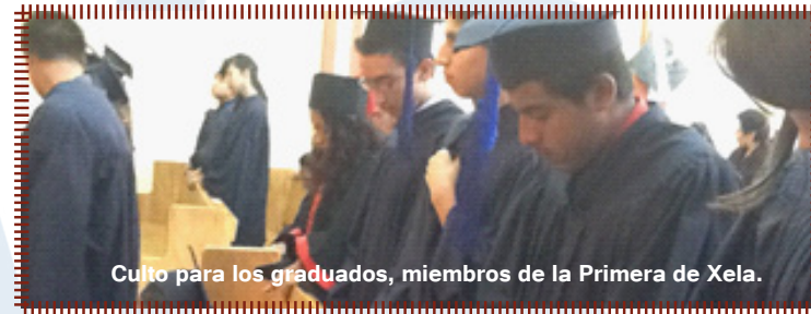
Culto para los graduados, miembros de la Primera de Xela.