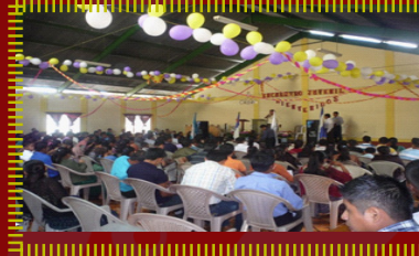
Vista de una de las concentraciones de los jóvenes k’ekchís.