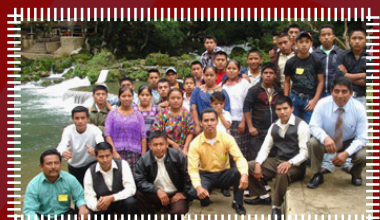
Pastores y jóvenes de San Juan Chamelco, en el balneario “Las Islas”