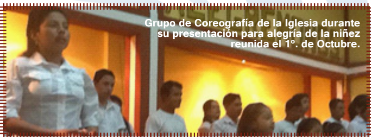
Grupo de Coreografía de la Iglesia durante su presentación para alegría de la niñez reunida el 1°. de Octubre.