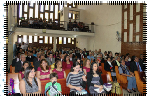
Parte de la congregación asistente a este culto especial.