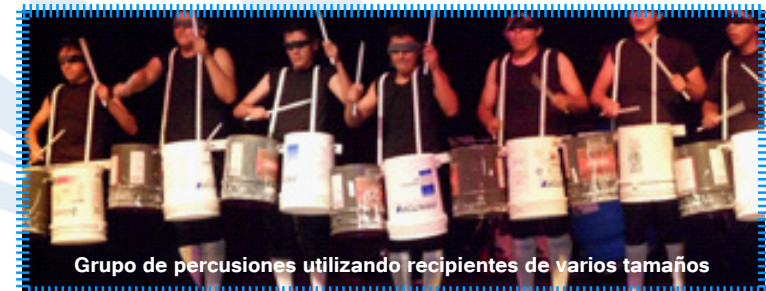
Grupo de percusiones utilizando recipientes de varios tamaños