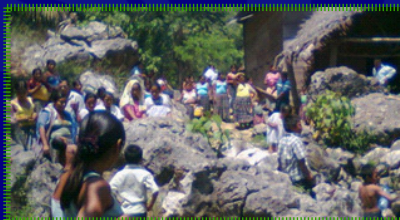
Reunión al aire libre en la misión “Sinaí” de Ukulchoch, El Petén, donde se ingresa por el lado de Livingston, Izabal.