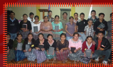
Delegación de la Iglesia Bautista “Jerusalén” de Pocolá, Carchá.