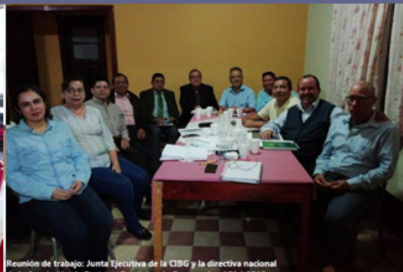
Reunión de trabajo: Junta Ejecutiva de la CIBG y la directiva nacional de la Asociación de Pastores Bautistas de Guatemala - 12feb2019