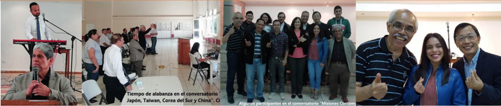
Tiempo de alabanza en el conversatorio Japón, Taiwan, Corea del Sur y China". C