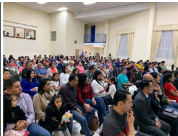
IGLESIA BAUTISTA LA VERDAD, Valle del Sol, zona 4, Mx. 1.-I. B. La Verdad, celebró su Aniversario 30, momento en que se ora por los varones de la congregación. 2.-Pastel del feliz aniversario. 3.-Congregación presente en esta celebración especial.