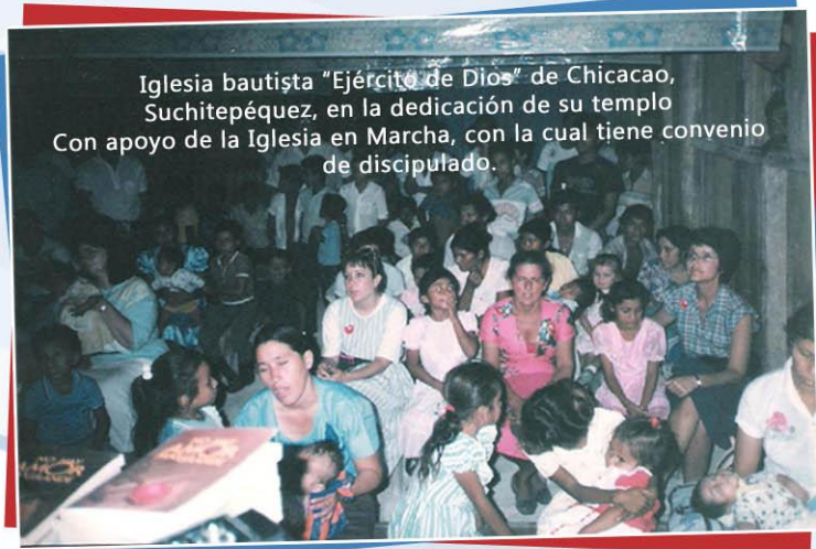
Iglesia bautista "Ejército de Dios" de Chicacao, Suchitepéquez, en la dedicación de su templo. Con apoyo de la Iglesia en Marcha, con la cual tiene convenio de discipulado.

7.- Y los materiales de la Iglesia en Marcha, son sencillos de manera que el vecino ó estudiante, llega a dar una respuesta lógica a la que ha sido guiado por el estudio. En los mismos hay interacción.