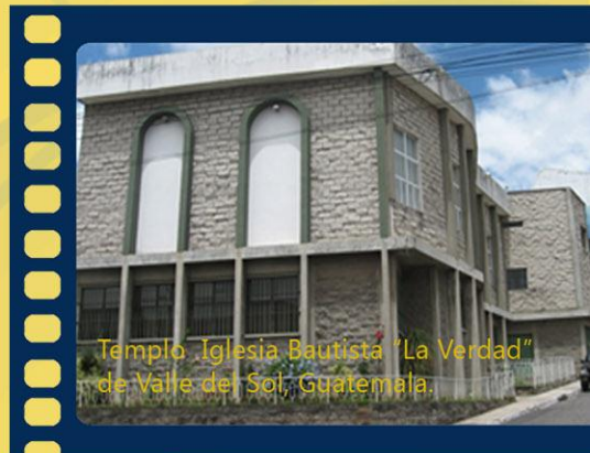
Templo Iglesia Bautista "La Verdad" de Valle del Sol, Guatemala.