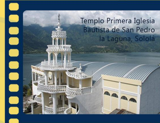
Templo Primera Iglesia Bautista de San Pedro la Laguna, Sololá