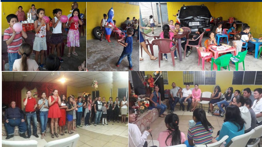
1.-El Día del Niño, fue celebrado en esta iglesia con concursos. 2.-Con el quiebre de piñatas. 3.-Y con una succulenta refacción. 4.-La juventud rio hondana alaba con expresión al Señor. 5.-También se reúne para meditar en su palabra.