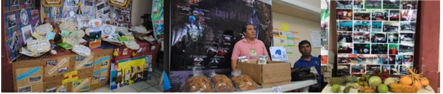
Las Asociaciones presentaron stands de información de la obra y de productos regionales. 1.-El de las Asociaciones Bautistas Kekchí, con artículos hechos de palma. 2.-La Asociación Bautista de Atilán, obsequio patín de Atilán; pan de San Pedro, y rosquillas de Tolimán. 3.-La Asociación Bautista del Nor Oriente y los productos propios del Caribe.