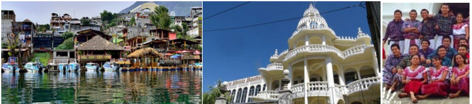
La 72 Asamblea Anual Bautista, será del 6 al 8 de Noviembre de 2018, en la Primera Iglesia Bautista de San Pedro la Laguna, Sololá. Haga planes con su iglesia para estar presente. 1.-Paisaje pedrano (arriba se ve el templo bautista). 2.-Templo de la Primera Iglesia Bautista. 3.-Grupo de sonrientes jóvenes de San Pedro la Laguna, Sololá.