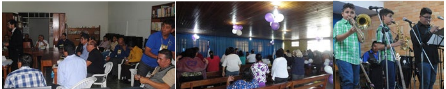
Reuniones simultáneas de las organizaciones. 7.-Unión Varonil Nacional. 8.-Unión Femenil Nacional (faltan aquí: el Ministerio Juvenil Bautista, la Asociación de Pastores, y la de Esposas de Pastores). 9.-Los fabulosos 3KIDS.