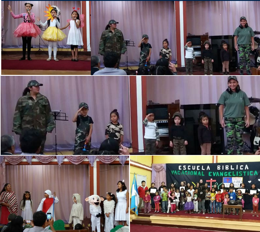
1.-En el Día del Niño, los kids presentaron sus habilidades y talentos. 2.-Los niños cantan "Somos soldaditos, siervos del Señor". 3.-Presentación de escenas bíblicas. 4.-La PIB de Quetzaltenango, realizó su Escuela Bíblica de Vacaciones con un énfasis evangelístico. Aquí algunos niños con sus maestros.