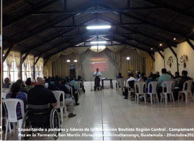
Capacitando a pastores y líderes de la Asociación Bautista Región Central, Campamento Paz en la Tormenta, San Martín Jilotepeque, Chimaltenango, Guatemala - 20 Octubre 2017