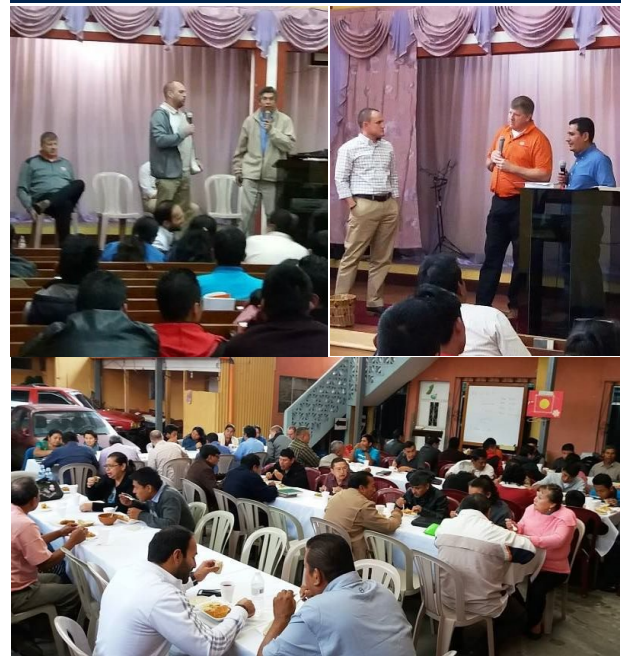
1.-Hermanos de Atlanta, Georgia, participan en la Cumbre de Liderazgo, para las iglesias de Occidente. 2.-Otros pastores que participaron con las conferencias. 3.-Los participantes de las iglesias de Occidente, degustan uno de los almuerzos, sirvió como sede la PIB de Quetzaltenango.