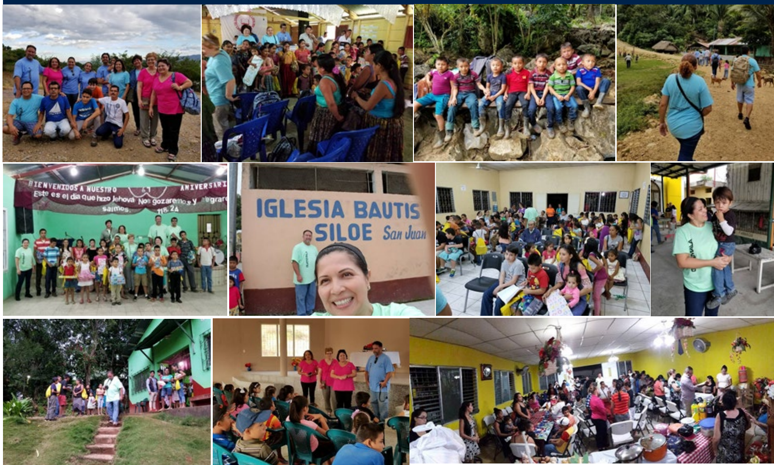
1.-Equipo misionero de Alabama, y directivos de la Asociación del Nor Oriente, inician la gira por varias congregaciones, para llevar la palabra de Dios y regalos a los niños. 2.-Iglesia Monte de los Olivos, Sepoc, Chahal, Alta Verapaz. 3.-Niños de Ukul Choch, Chahal, en un tronco observan la llegada de los misioneros. 4.-El equipo misionero por las veredas del nor oriente del país. 5.-Iglesia Cristo Viene, San Francisco, Livingston. 6.-Templo Siloé, Santo Tomás de Castilla, Izabal. 7.-Iglesia Edén, Morales, Izabal. 8.-Primera Iglesia Bautista de Bananera, Izabal. 9.-Iglesia Monte Horeb, El Gran Cañón, Izabal. 10. -Misión Bautista de Teculután, Zacapa. 11.-Y Finalmente, Primera Iglesia Bautista de Río Hondo, Zacapa, donde se les ofreció una recepción.