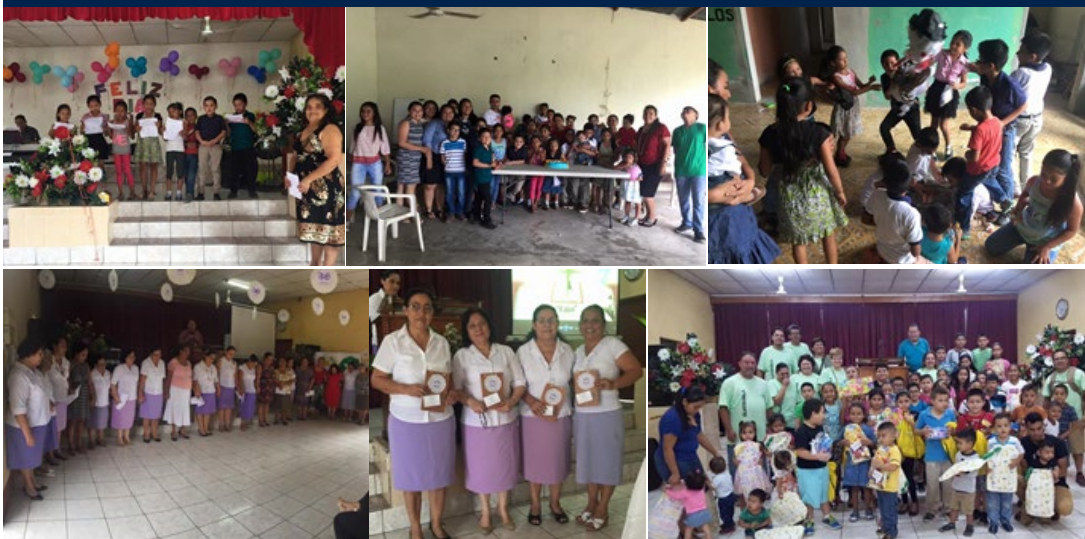
1.-Esta iglesia festejó con gozo el Día del Niño, en la cual participaron por edades. 2.-Grupo de niños con sus maestros. 3.-Siempre presente el quiebre de piñatas. 4.-Grupo de la Unión Femenil que celebró su aniversario. 5.-Las hermanas de La directiva reciben una plaqueta por su denodado esfuerzo. 6.-Un grupo de Alabama, obsequió a los niños de la iglesia, Regalos para el gozo de los chiquillos.