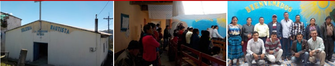
1.-Templo de la Iglesia Bautista del municipio de Ixchiguan. 2.-En este lugar se tuvo una capacitación para los hermanos de la Asociación del idioma Man denominada CAB LAJ. 3.-Pastores que llegaron de las congregaciones de Ixchiguan; Tajumulco; Sibinal y Tacaná.