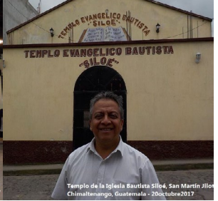
Templo de la Iglesia Bautista Siloé, San Martín Jilotepeque, Chimaltenango, Guatemala - 20 Octubre 2017