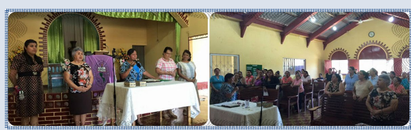
PUERTO BARRIOS, IZABAL: PRIMERA IGLESIA BAPTISTA 1.-La directiva de la Unión Femenil Nacional, inserta en la foto ofreció una capacitación. 2.-Mujeres de las Uniones asistentes.