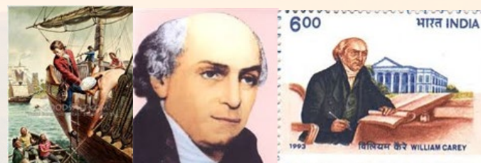
Desembarco en Serampore, India. William Carey. Sello postal emitido por el gobierno hindú

En 30 años Carey y sus compañeros llevaron la Palabra de Dios a la tercera parte del mundo conocido en su época y antes de morir en Serampore, Bengala, se publicó un cuarto de millón de la Biblia en 40 idiomas hablados por 330 millones. Hoy, más de dos millones de bautistas en la India deben su herencia a la visión y misión de William Carey.