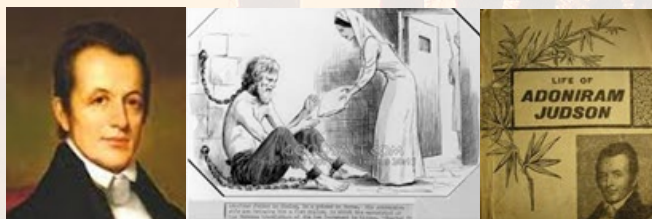
Adoniran Judson. Su esposa Ana le lleva comida a la prisión de Rangún. Copia de uno de los libros sobre Judson.

Cuando se firmó la paz, Adonirán Judson actuó como traductor ante el terror de los que le habían atormentado y pensaban que se vengaría, pero él les dio una lección cristiana de amor y perdón. En 1826 perdió a su esposa. Se casó de nuevo y volvió a perder a su esposa en 1845, casándose por tercera vez. En 1849 vio publicado la mitad de su diccionario, y cuando enfermo viajaba a Inglaterra, falleció. Actualmente hay más de un millón de bautistas birmanos en Myanmar y Tailandia.