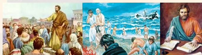
Pablo en el Areópago de Atenas (Hch.16:17-34). Naufragio de Pablo en la isla de Malta (Hch.27:26-44). Legado: 13 Libros del NT.

Por los Hechos de los Apóstoles se sabe que fue preso en Jerusalén por causa de los judíos y que fue conducido a Roma. Él refiere su próxima muerte (Hch.20:24-38). Fue ejecutado en Roma en el año 62. Escribió 13 libros del Nuevo Testamento.