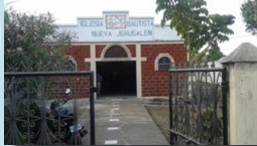
Foto 1: Congregación de la Iglesia Bautista "Nueva Jerusalén" de Horcones, Santa Catarina Mita, Jutiapa, que el 15 de Marzo fue recibida como miembro de la CIBG. Foto 2: Templo de la Iglesia miteca. Para el culto de recepción llegó un equipo de hermanos, líderes de la CIBG y de la Asociación del Sur-Occidente.