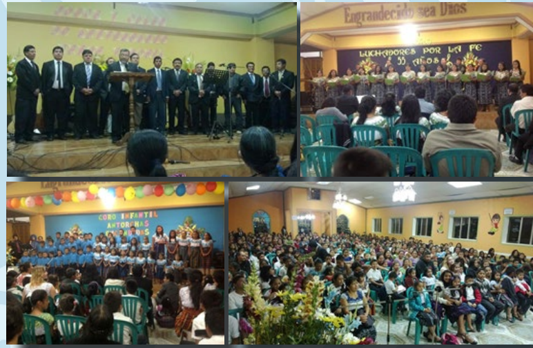
Foto 1: La Unión Varonil Josué y Caleb, de la Iglesia Bautista Getsemani, San Pedro la Laguna, en su Aniversario y toma de protesta de sus directivos. Foto 2: Presentación del coro juvenil Luchadores por la Fe, con motivo de sus 55 años de vida. Foto 3: El coro infantil Antorchas Encendidas, se viste de gala en la presentación de su aniversario. Foto 4: Concurrencia que asistió a esta última presentación.