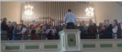
Coro Juvenil Bautista del Este, hoy de adultos que hace 25 años cantó en Berlín

Fundó 280 iglesias, 1,222 puntos de predicación, 771 Escuelas Dominicales en Alemania; 170 iglesias en otros países, un millón de bautistas en los países soviéticos son su herencia espiritual; fue responsable de distribuir 2 millones de Biblias y 9 millones de tratados. Su esposa falleció en 1845 y se volvió a casar. Su frase célebre: "Cada bautista un misionero" y su texto: Ef.4:5. "Un Señor, una fe, un bautismo". (Ef. 4:5), que hoy es el lema de la Alianza Mundial Bautista. Ojalá, surjan otros misioneros como él.