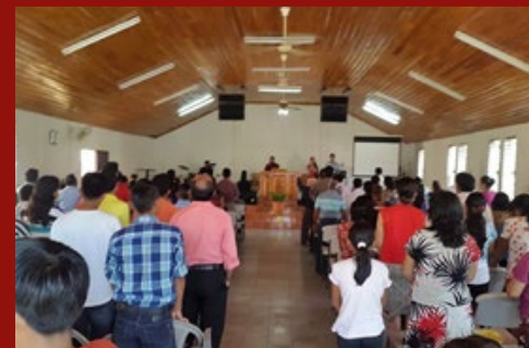
Foto 2: La Región de Iglesias Bautistas del Sur-Occidente Frontera, se reunió en Coatepeque centro, en el mes de Enero (incluye congregaciones del sur de San Marcos y sur de Quetzaltenango), mostrando gran crecimiento en la apertura de nuevas obras. Foto 2: Grupo de alabanza de la Primera Iglesia Bautista de Coatepeque, dirigiendo los cantos. Foto 3: También el Grupo de Alabanza de Jadib participó.