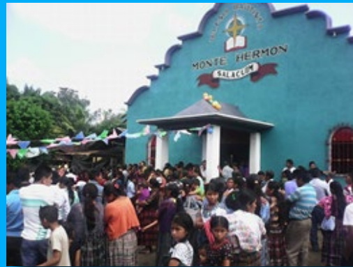
Foto 1: La Misión Bautista Monte Hermón, de Salacuín, Playa Grande, Ixcán, El Quiché, celebró el aniversario de la Unión Juvenil. Foto 2: En las reuniones tenidas predicó el pastor Walter Winter de El Estor, Izabal.