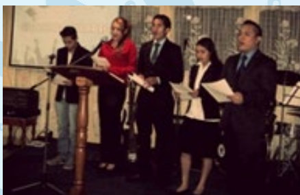
Foto 1: Culto de Acción de gracias a Dios por los graduados de la Iglesia Bautista Jesucristo el Señor, de la Col. La Verbena, zona 7. Foto 2: Clausura de la Escuela Bíblica de Vacaciones, con los niños al frente. Foto 3: Dinámica de la Unión Juvenil, en el convivio de fin de año. Foto 4: Hnas. Del ministerio de música ejecutan un villancico navideño. Foto 5: Un grupo de niños presenta un acróstico sobre la navidad. Foto 6: El coro de la iglesia, ejecuta música navideña en el culto del 24 de Diciembre.