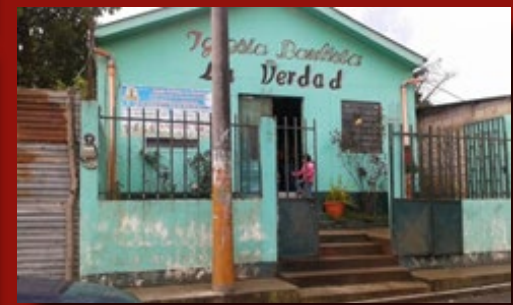
Foto 1: Muestra el templo de la Misión Bautista La Verdad, de Tecpán, Chimaltenango, atendida por la Iglesia del mismo nombre en Valle del Sol, Guatemala. Foto 2: Culto de clausura de la Escuela Bíblica de Vacaciones, el primer domingo de Diciembre.