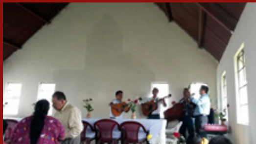
Foto 1: Interior del templo donde los hermanos se preparan para una celebración. Foto 2: Adjunto funciona la sede de la extensión del Seminario Bautista.