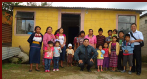
Foto 1: Casa donde se reúne la nueva Misión Bautista Elim, en el populoso pueblo de Patzún, Chimaltenango. Foto 2: Interior de la casa con hermanos congregados. Esta es una misión de la nueva Iglesia Bautista Elim de la zona 21, Guatemala.