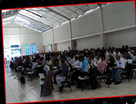
Una de las sesiones plenarias de la 65ª. Asamblea Anual Bautista.

RESPUESTA: A la convocatoria de la Comisión Ejecutiva de la CIBG, respondieron 204 mensajeros de 107 iglesias. Con satisfacción hubo presencia de los 18 grupos geográficos del país, sean, asociaciones regionales ó sectores metropolitanos; aunque con mayorías de: la Asociación K'ekchi (42); Sectores Metro Occidente (34); Metro Nor-Central (27); Metro Sur-Oriente (17); las Asociaciones Nor-Oriente, Occidente y Sur-Occidente (13 cada una).