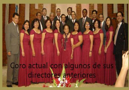
Coro actual con algunos de sus directores anteriores

Este coro ha participado en eventos bautistas en cada país de Centro América, Panamá y Texas; en "Musicorales" (de la Universidad); "Guatecorales" (del Coro Nacional); y otros.