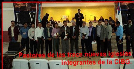
Pastores de las trece nuevas iglesias integrantes de la CIBG.