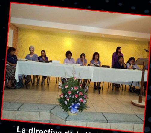
La directiva de la Unión Femenil Nacional Misionera, dirigiendo su sesión.