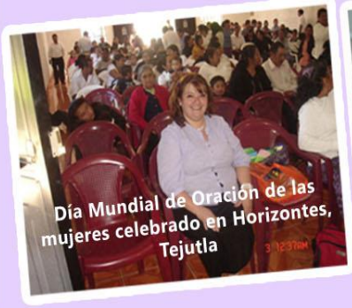
Día Mundial de Oración de las mujeres celebrado en Horizontes, Tejutla