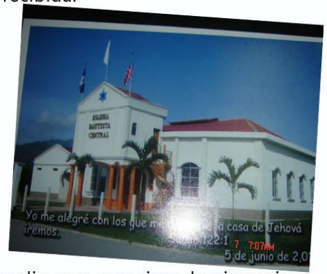
Yo me alegré con los que me... a casa de Jehová iremos. 22:1 7 7:07AM 5 de junio de 2011

El templo tiene capacidad para 500 personas, y en su amplio terreno esperan levantar las aulas para la Escuela Dominical, que también se utilizarán para un colegio; un salón de usos múltiples, amplio para que sirva de gimnasio y una cocina para las fiestas de la iglesia, todo con el fin de ser testimonio de las buenas nuevas a la comunidad.