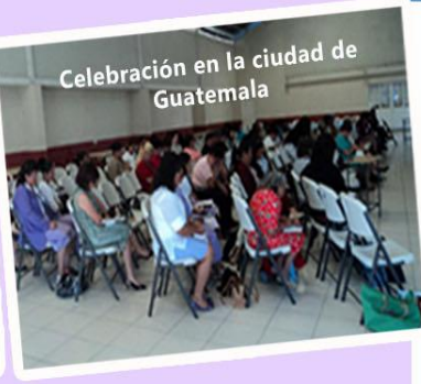
Celebración en la ciudad de Guatemala