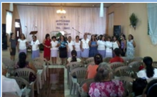
Foto 1: La Unión Femenil "Heroínas Por Cristo" de la Iglesia Bautista Emanuel, de la zona 1, de la Ciudad de las Palmeras, celebró un aniversario más de vida. En la gráfica con su tradicional vestuario en lila y blanco, entonan una alabanza de gratitud al Señor. Foto 2: Mientras tanto la Juventud "Emanuelense" tuvo una tarde deportiva bajo el lema: "Hagamos Ejercicio".