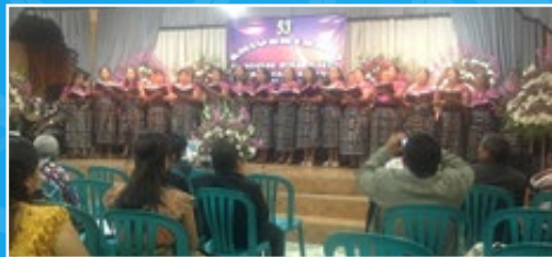
Foto 1: La Unión Femenil Bautista "Dora de Cadwallader" de esta iglesia celebró su 53 aniversario, con un culto en el que participó el coro femenino de la misma. Foto 2: El Coro oficial de la Iglesia participó en el "IV Festival Navideño de Coros" sobresaliendo por la calidad de sus interpretaciones. Foto 3: El Coro Juvenil, presentó himnos especiales preparados para el fin del año 2013. Getsemaní posee cuatro coros: infantil, juvenil, femenino y mayor. Foto 4: Otro grupo musical de la iglesia, lo conforma la Rondalla "Josué y Caleb" que participó en el aniversario de la Unión Varonil local.