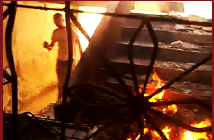
Foto sustraída de video publicado Facebook por el pastor de FBC, El Cairo.