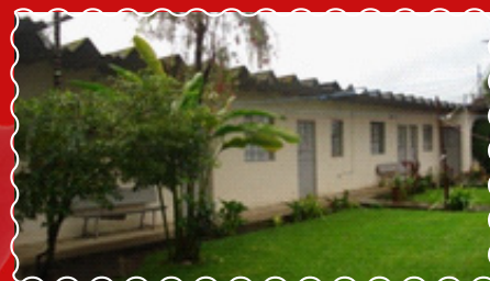
3: un anexo al final del área verde.