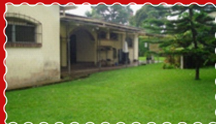
2: la parte posterior.