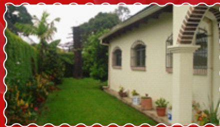
1: El ingreso a la misma.

Las fotos muestran la casa que los Hnos. k'ekchís, con tremendas expresiones de fe, desean tomar en propiedad.